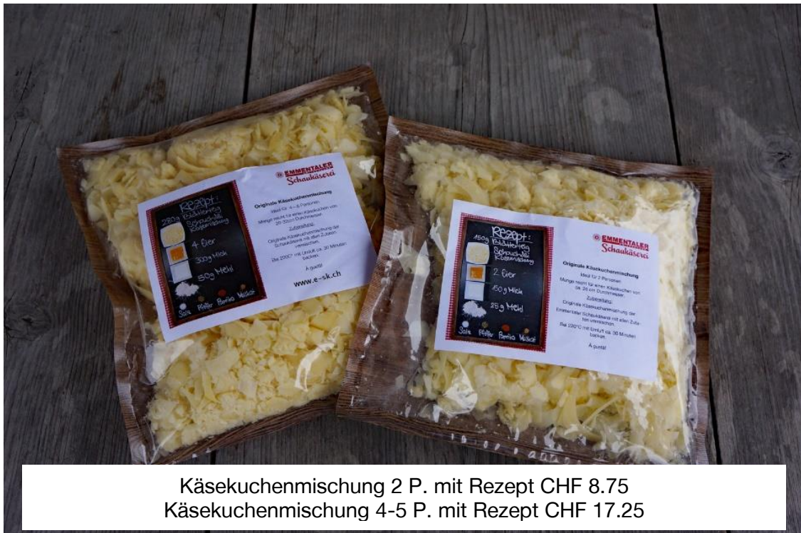
Käsekuchenmischung 2 P. mit Rezept CHF 8.75 Käsekuchenmischung 4-5 P. mit Rezept CHF 17.25