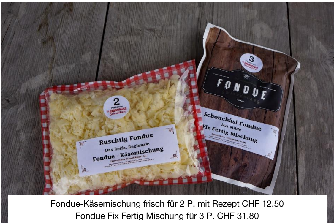
Fondue-Käsemischung frisch für 2 P. mit Rezept CHF 12.50 Fondue Fix Fertig Mischung für 3 P. CHF 31.80