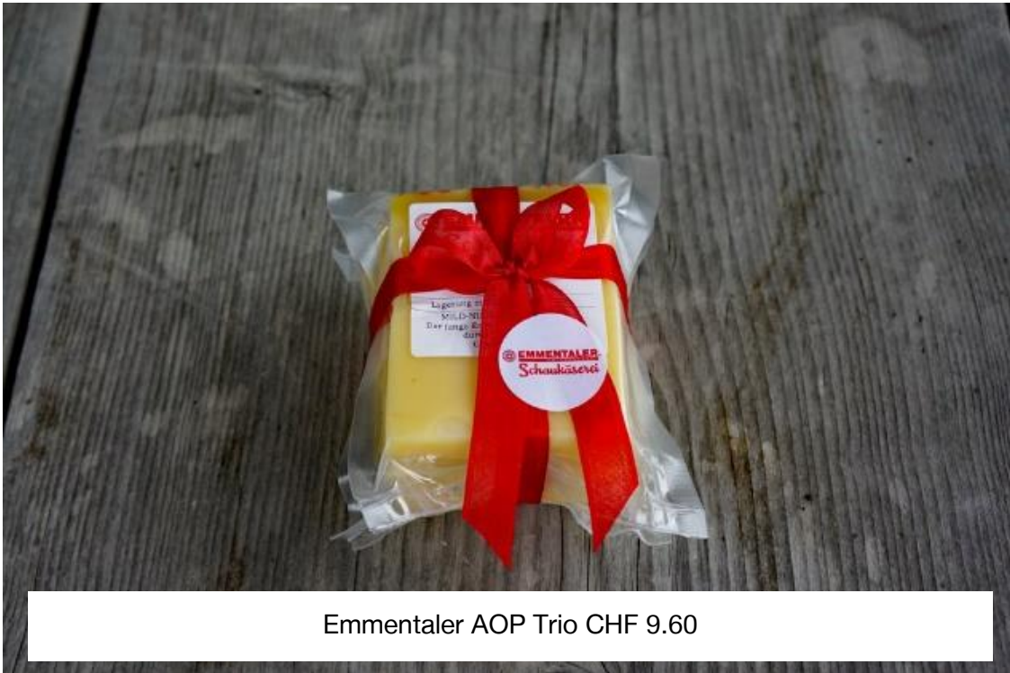
Emmentaler AOP Trio CHF 9.60