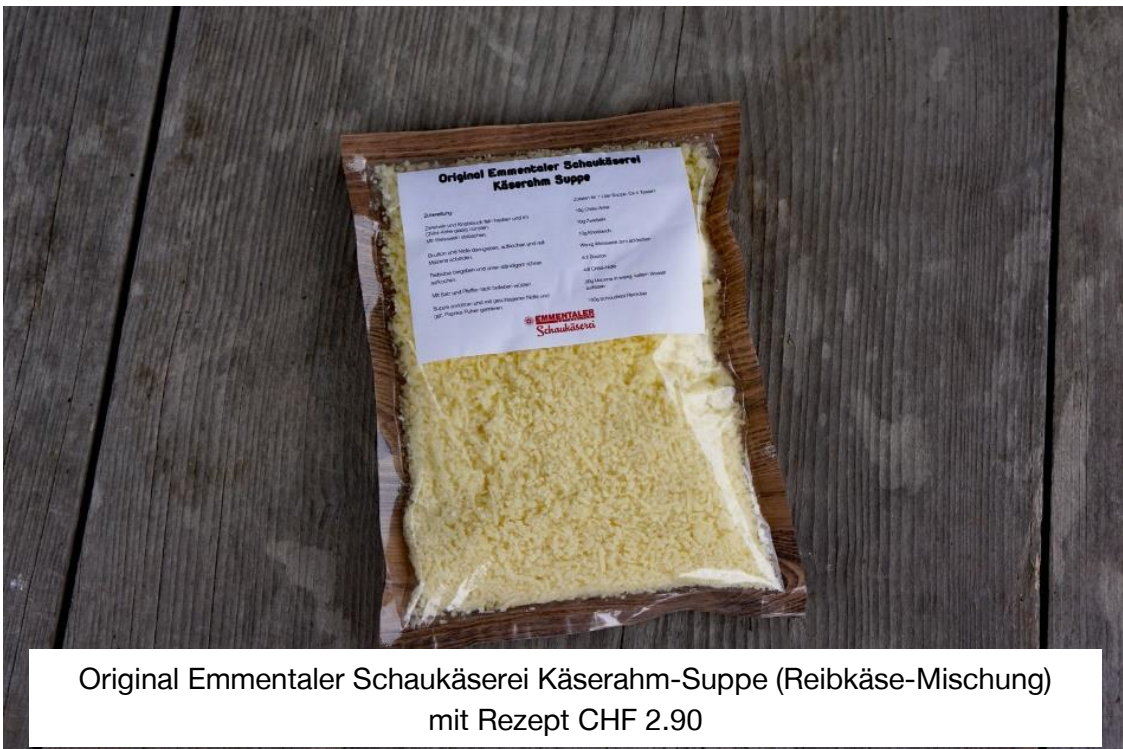
Original Emmentaler Schaukäserei Käserahm-Suppe (Reibkäse-Mischung) mit Rezept CHF 2.90